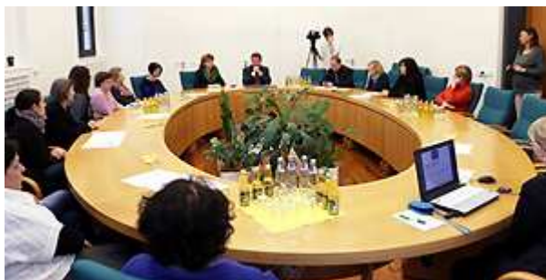
Unterzeichnung der EU – Charta für Gleichstellung

Das Gleichstellungsamt der Landeshauptstadt Magdeburg erarbeitete einen Aktionsplan zur Umsetzung der Europäischen Charta mit Maßnahmen und Projekten, die in den letzten Jahren zu diesem Thema beschlossen wurden sowie zu planenden Aktionen. Der Aufbau des Aktionsplanes orientiert sich an den „Vorschlägen zur Erstellung von Gleichstellungs-Aktionsplänen zur Umsetzung der EU-Charta für die Gleichstellung von Frauen und Männern auf lokaler Ebene“ der Bundesarbeitsgemeinschaft kommunaler Frauenbüros und definiert die fünf wichtigsten Handlungsfelder für die Bekämpfung von Gleichstellungsdefiziten in der Landeshauptstadt Magdeburg.