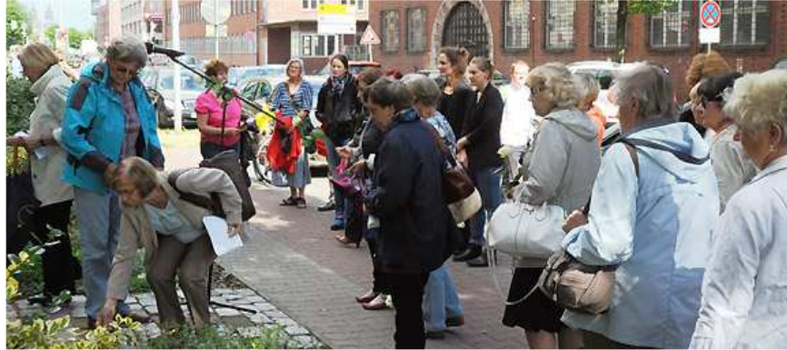
Gedenkveranstaltung am ehemaligen Frauen-KZ