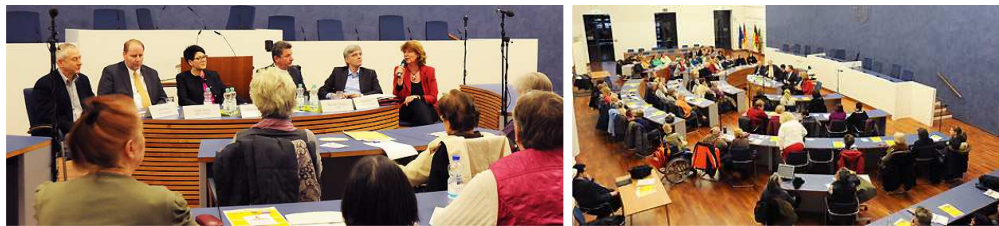
Vorstellung der Kandidaten und Kandidatinnen im großen Ratssaal