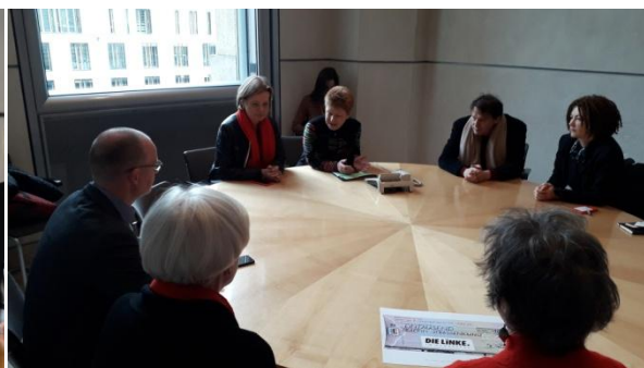
Runde im Gespräch