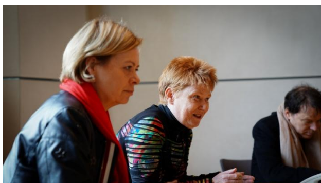
Gesine Löttsch & Petra Pau, MdBs, DIE LINKE

Der Verein der in der DDR geschiedenen Frauen e.V. ging 2017 unter die NEUE AUFTRAGGEBER für ein Kunstwerk. Nach wechselvollen Vorgesprächen fanden genauere Planungen zu dem Kunstwerk zum Mitmachen statt. Anfang November fanden einige Fotosession mit den Künstlerinnen und den Frauen aus dem Verein statt. Der Verein knnte sich erneut über eine Spende seitens des Fraktionsvereins der Linksfraktion im Bundestag freuen, damit er das Kunstwerk wenigstens minimal finanziell unterstützen kann. Unten Fotos von der Scheckübergabe durch Bundestagsvizepräsidentin Petra Pau sowie