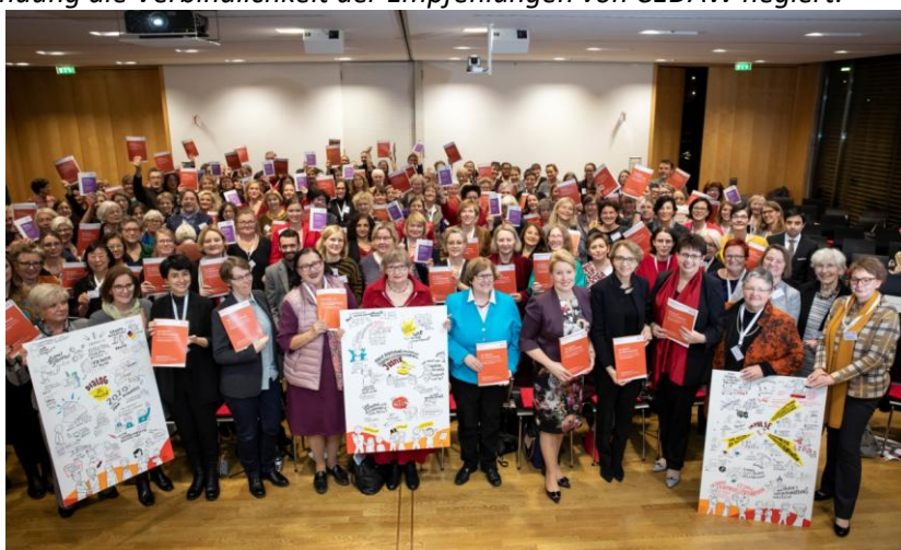
Gruppenbild: 27.11. 40 Jahre Frauenrechtskonvention CEDAW- alle Teilnehmenden

Die Bundesregierung ist in ihrem Koalitionsvertrag den Abschließenden Bemerkungen CEDAW von 2017 nicht gefolgt. Sie will kein „staatliches Entschädigungssystem zur Wiedergutmachung durch Ergänzung der Renten von Frauen, die sich in der ehemaligen Deutschen Demokratischen Republik geschieden haben“, einführen. Sie strebt stattdessen einen Härtefallfonds an, der lediglich der Hälfte der Betroffenen zugutekäme, deren Renteneinkommen an und unter der Armutsgrenze liegt. Sie will sich explizit nicht auf die den Frauen* seit der Einheit vor 30 Jahren aberkannten Rentenansprüche und die damit verbundene Diskriminierung beziehen. So bleiben 50% der Frauen* vom Verlust von ca. einem Drittel ihrer verdienten Rente betroffen. Die Bundesregierung hat in ihrem Zwischenbericht 2019 an CEDAW erneut abgestritten, dass diesen Frauen* Rentenansprüche aberkannt wurden. Die Bundesregierung räumt in vielen Quellen ein, dass den Frauen* Unrecht geschah und beharrt im Widerspruch dazu darauf, die Diskriminierung der Frauen* gegenüber ihren Ex-Ehemännern* nicht zu beseitigen, die vom Gesetzgeber zur Zeit der Einheit verursacht wurde. Wir sehen mit großer Besorgnis, wie die Bundesregierung im Zwischenbericht dazu die Empfehlung des CEDAW-Ausschusses zurückweist und wie sie im nationalen Dialog mit den Betroffenen und in Gremien der Entscheidungsfindung die Verbindlichkeit der Empfehlungen von CEDAW negiert."